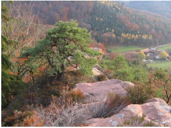
Bärenbrunnerhof mit Schandariefels

Termine, Dauer & Preise nur nach individueller Absprache.