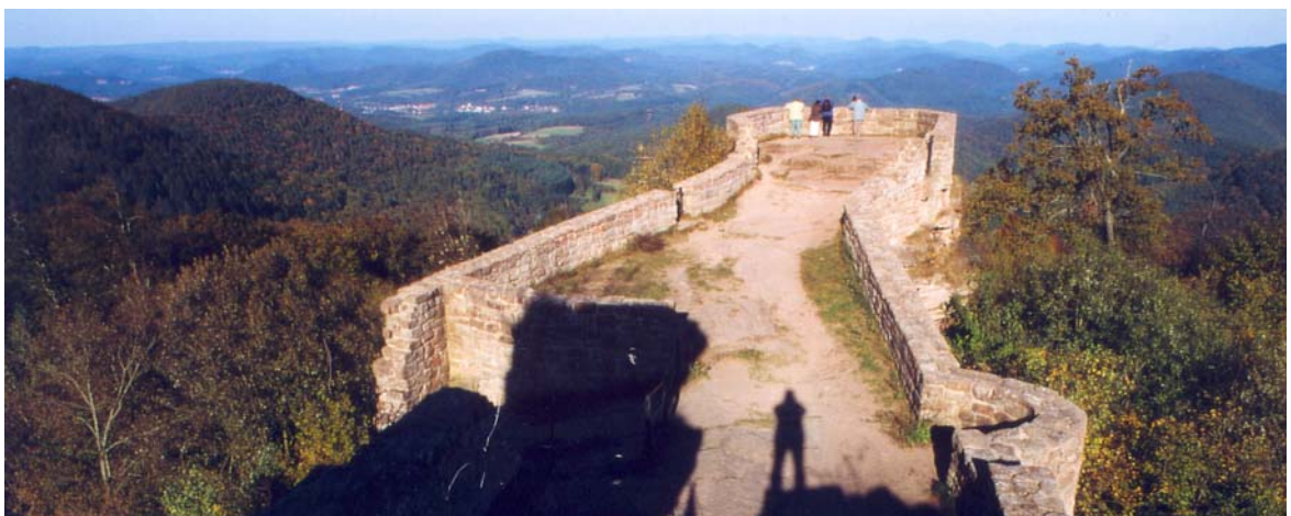
Wegelnburg im Panoramablick