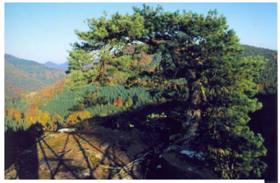
Felsenkiefer auf Burg Blumenstein