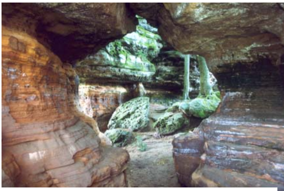
Felstentor der Altschlossfelsen