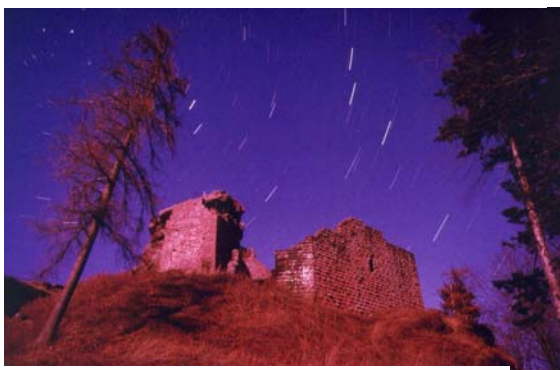
Hohenburg bei Vollmond