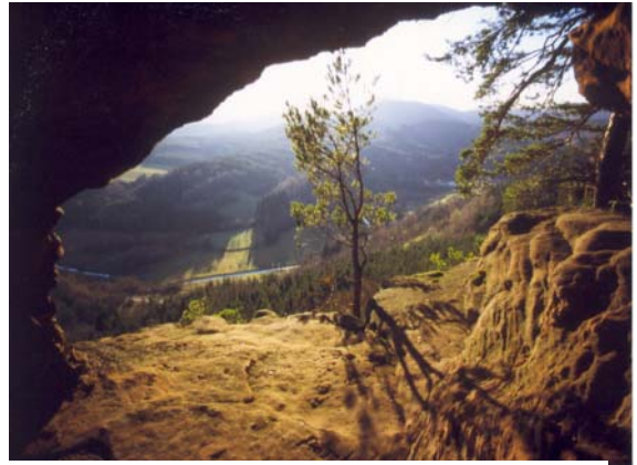
Soldatenhütte am Hochstein