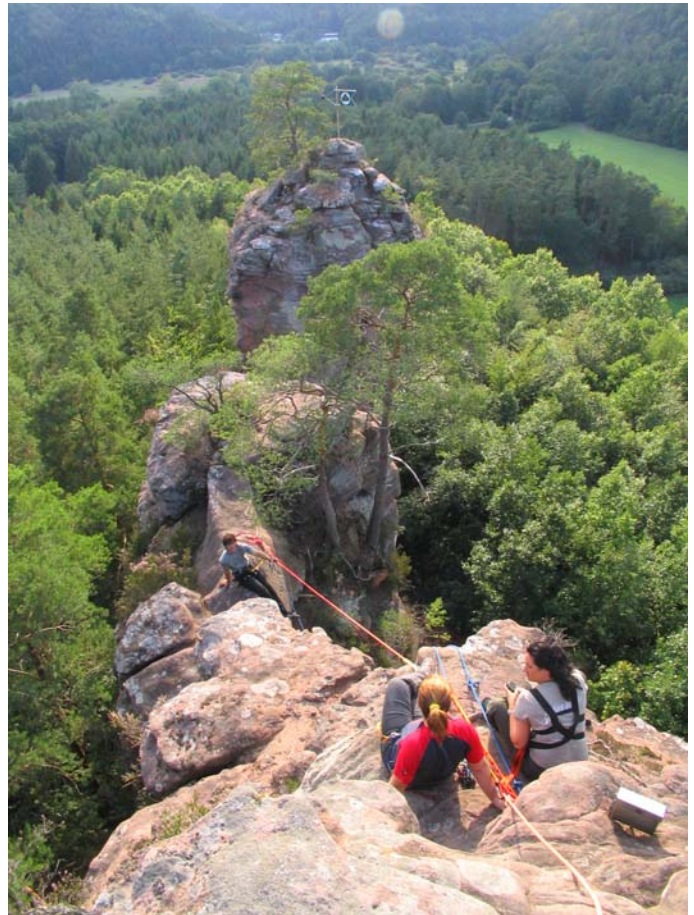
auf dem Felsmassiv vor dem „Flying Fox“

Achtung: Der Cliffhanger-Parcours kann eine Grenzerfahrung sein !!!